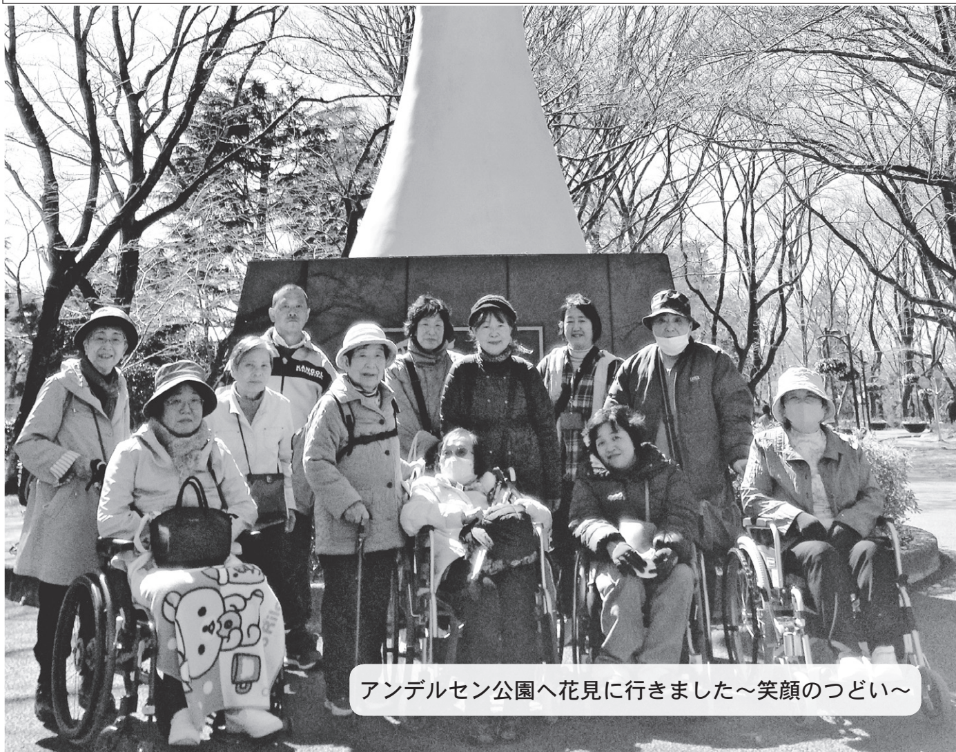
アンデルセン公園へ花見に行きました～笑顔のつどい～