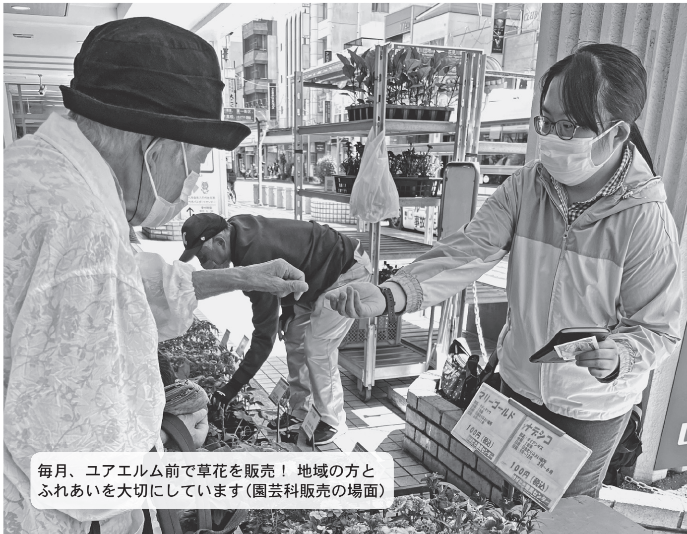
毎月、ユアエルム前で草花を販売！ 地域の方とふれあいを大切にしています（園芸科販売の場面）