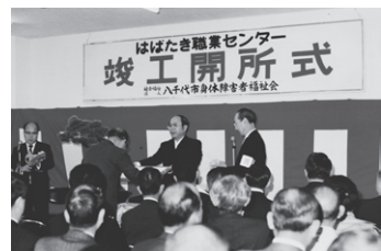
1980 年 はばたき職業センター 開所式

その後「身体障害者の働く拠点づくり」を目標に、昭和 55 年に社会福祉法人認可を受け、同年 4 月 17 日に身体障害者通所授産施設「はばたき職業センター」として開所いたしました。以来今日まで、社会情勢・制度・福祉環境などの変化に伴い事業体系を変えながらも、障害者の地域生活に関する支援と就労に関する支援を中心に様々な福祉事業を展開しております。 先人たちの努力と皆様の応援や支援によって、現在も利用者さんたちが元気に作業をすることが出来ております。本当にありがとうございます。これからも引き続きよろしくお願ひ申し上げます。