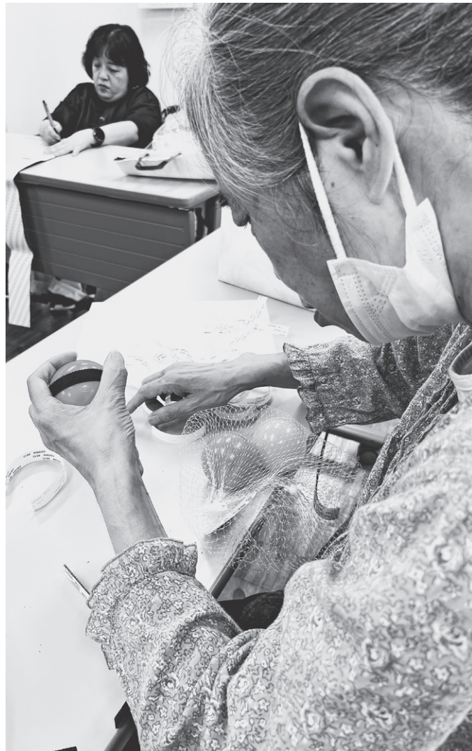
八千代市障害者スポーツ大会開催に向けて 用具の準備が急ピッチで行われています (詳細は3面)