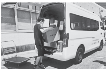
納品に行ってきます。

座位姿勢での一日なので、午前 1 回、午後 2 回のストレッチを欠かさず行っています。みんな仲良く楽しく作業を行うことを心掛けています。